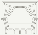
ახალგაზრდობისა და კულტურის განვითარების განყოფილება